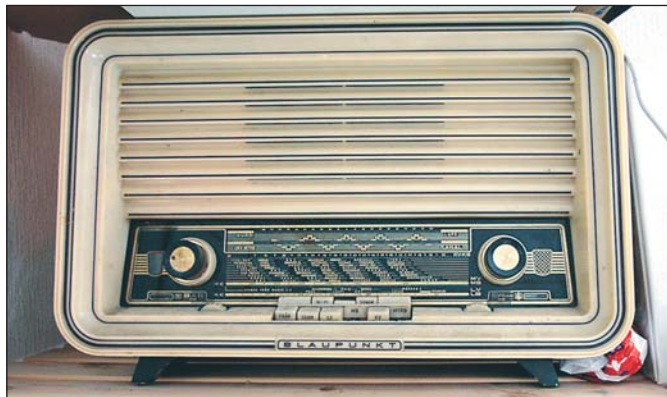
I mitten av trettioalet fanns 5 000 radioapparater i Hudiksvall och det etablerades även en radiofabrik i staden på fyrtioalet. Den här radioapparaten är från femtiotalet.