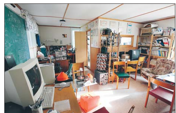
I den forna radiostationen har numera Hudiksvalls sändaramatörer sin verksamhet.