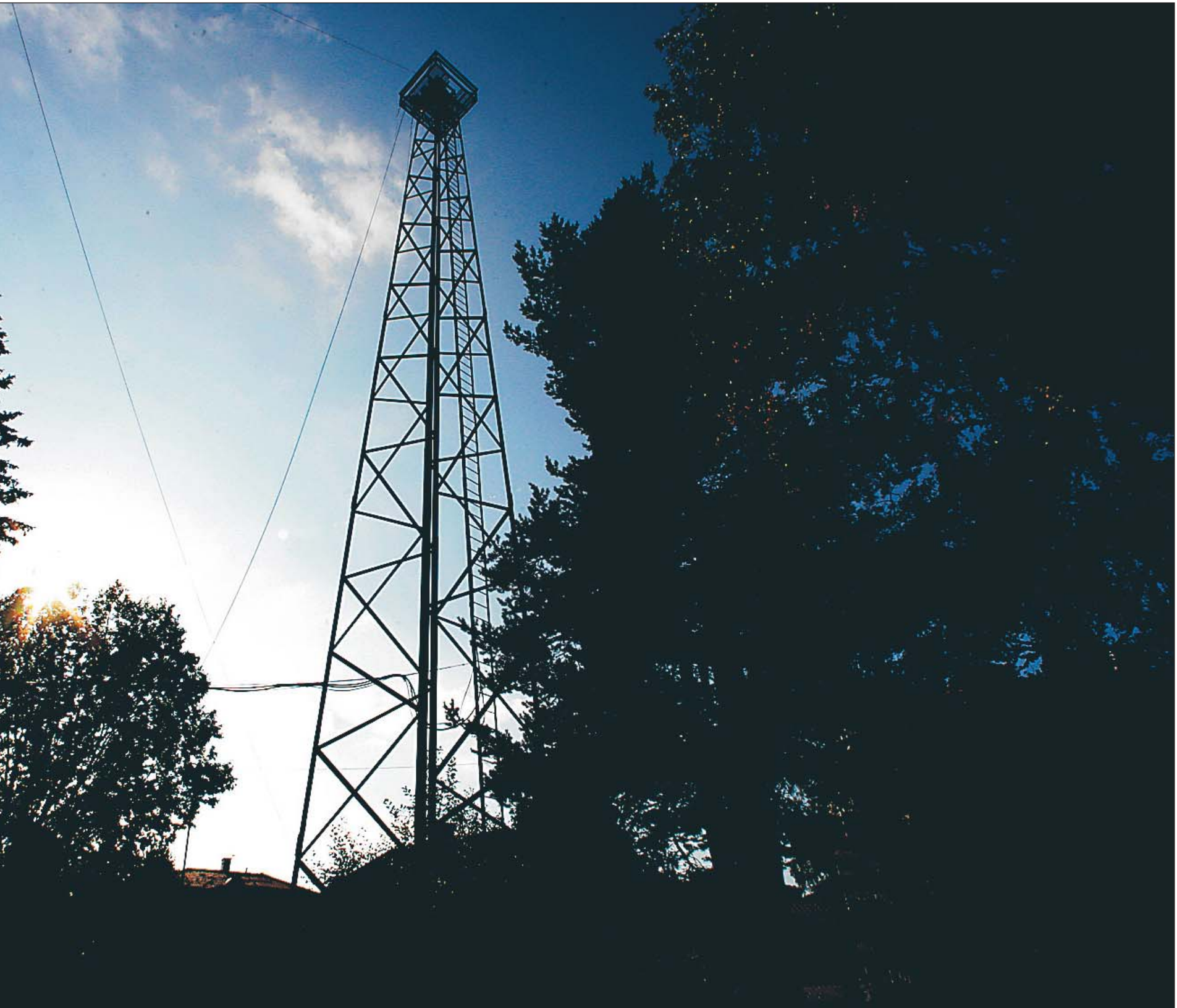
...trettioalet och både byggnaden och radiomasterna står kvar.