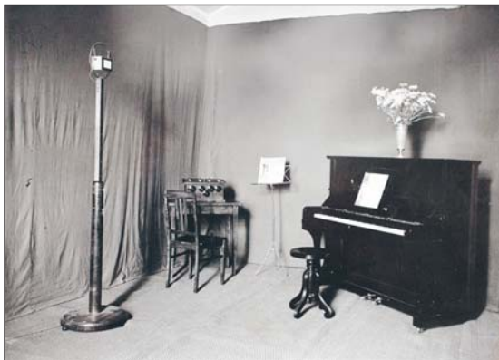
Så här såg den första radiostudion i Hudiksvall ut. Det var en tämligen enkel miljö, men från studion sändes varje tisdag lokala program. Mest handlade det om föredrag och klassisk musik.