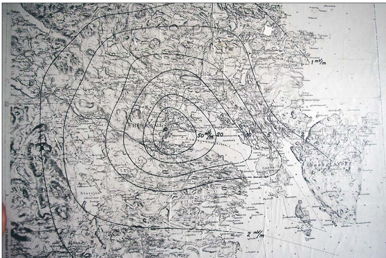
En täckningskarta över Hudiksvall med närmaste omgivningar. Kartan är från mitten av femtiotalet.